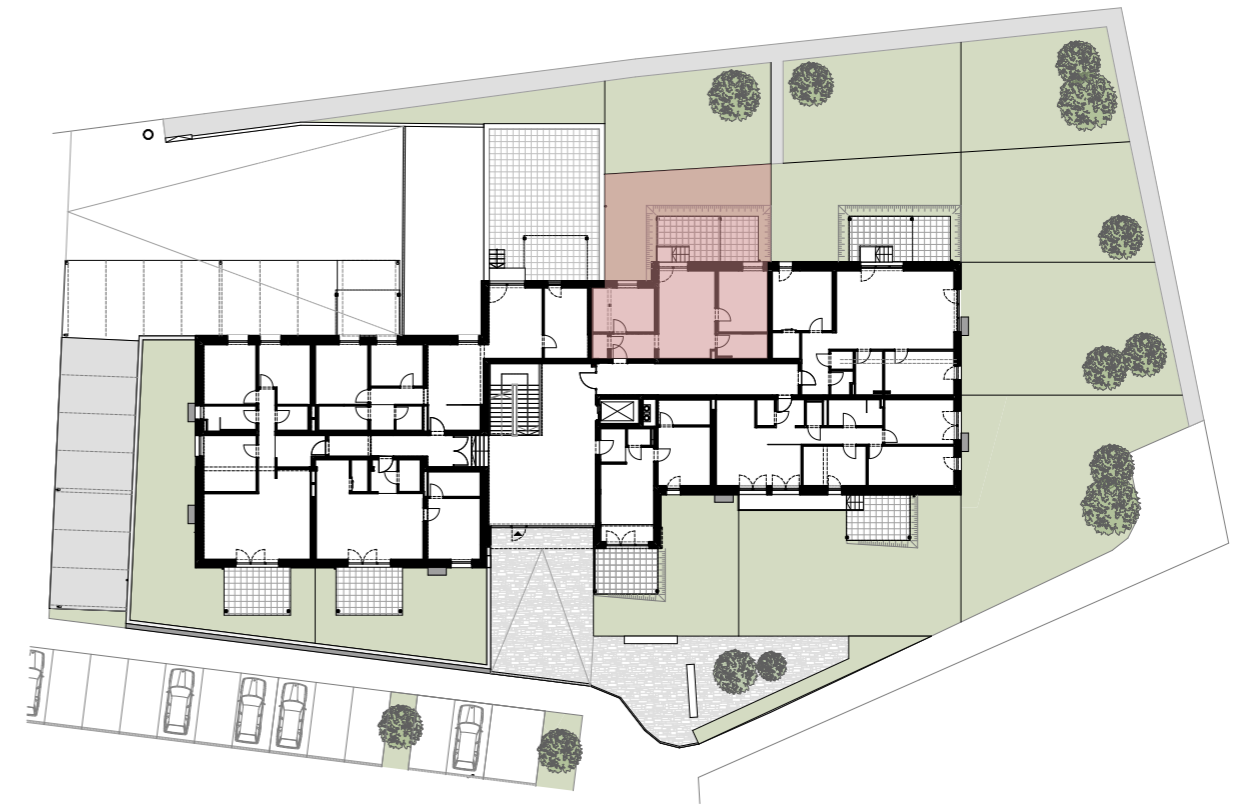
ÜBERSICHTSPLAN ERDGESCHOSS M 1:500