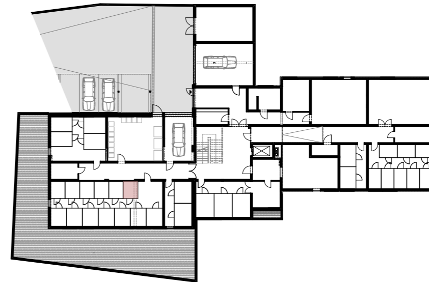
ÜBERSICHTSPLAN KELLER M 1:500