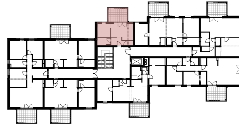
ÜBERSICHTSPLAN 2.OBERGESCHOSS M 1:500